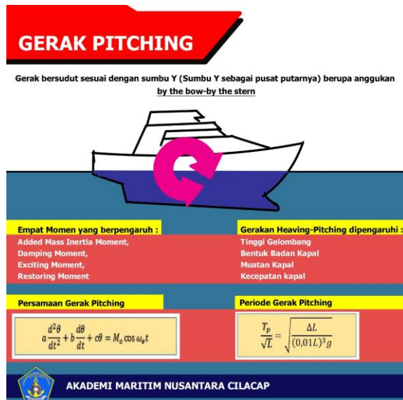
Gambar.5 Gerak Pitching

Berdasarkan tampilan beberapa gambar tersebut diperoleh hasil kajian menunjukkan bahwa penerapan dinamika gerak pada kapal laut menggunakan media gambar dapat menunjukkan gambaran yang lebih jelas pada penerima pesan baik peserta didik maupun khalayak umum dalam memahami ilmu pengetahuan atau materi yang disajikan dengan tampilan lebih menarik. Media gambar yang ditampilkan didesain lebih menarik serta dikaitkan dengan prinsip matematika dan fisika sebagai gabungan dalam materi dinamika gerak pada kapal laut. Hal tersebut sejalan dengan yang disampaikan oleh peneliti lain bahwa Persoalan dinamika gerak adalah