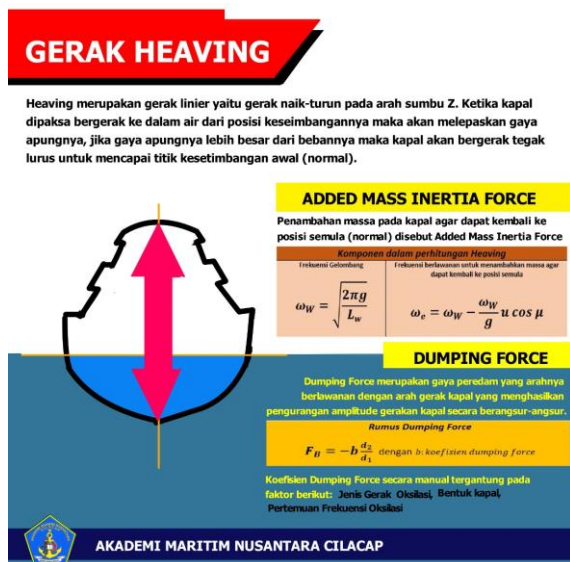
Gambar.3 Gerak Heaving