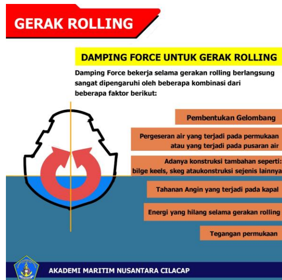
Gambar.4 Gerak Rolling