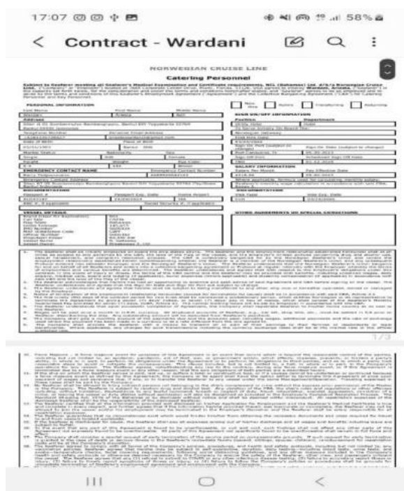
Gambar 5. Kontrak Awak Kapal

Kontrak setiap crew akan diberikan saat H-3 dari tanggal sign on . Dalam kontrak tersebut tercantum beberapa informasi sebagai berikut : Nama Crew, tempat tanggal lahir, nama orang tua, kontak personal, gaji, durasi kontrak, tanggal sign on dan sign off , nama kapal informasinya, dan pelabuhan sign on .