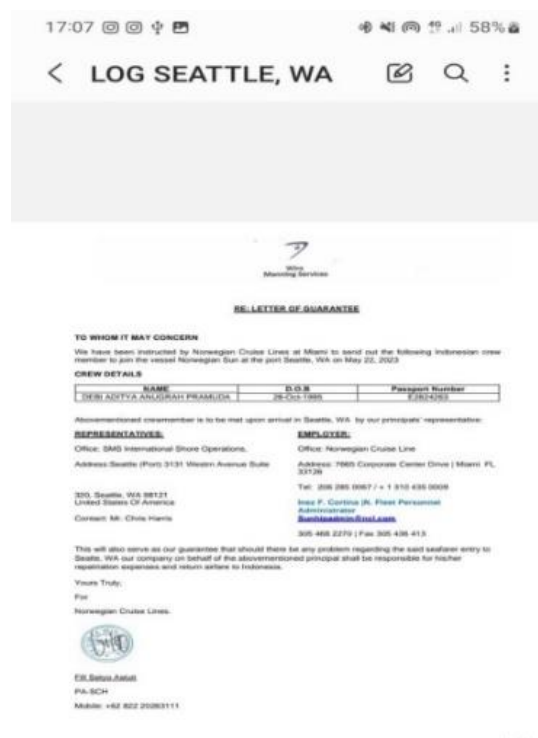
Gambar 4. Letter Of Guarantee ( LOG )

Crew atau awak kapal akan diberikan LOG yang berfungsi sebagai pengantar bandara crew yang akan join pada suatu