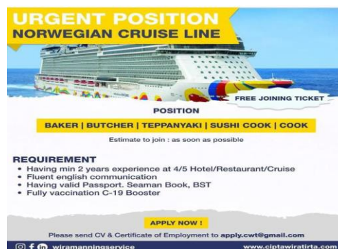
Gambar 2. Postingan promosi di Sosial Media

Pada saat persediaan ex-crew pada rotation plan tidak ada lagi kandidat yang akan dicalonkan sebagai crew pengganti, PT. Cipta Wira Tirta segera melakukan perekrutan new hire dengan memposting atau mempromosikan di sosial media bahwa sedang membutuhkan kandidat untuk crew atau awak kapal yang di butuhkan.