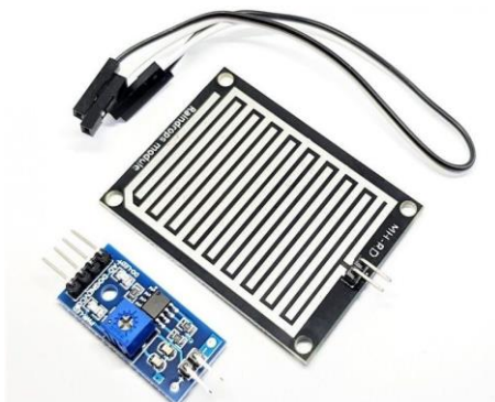
Gambar 3. Rain Sensor

penyambungan dua terminal pada saat terkena hujan. Untuk memberi sinyal pada sensor hujan agar mendeteksi hujan, rangkaian memberikan sinyal keluaran berupa buzzer dan LED. Prinsip pengoperasian alat ini adalah ketika sensor hujan yang telah dirakit dan dihubungkan dengan baterai dan saklar pada posisi ON maka sensor akan mendeteksi hujan dengan membunyikan buzzer dan menyalakan LED ketika sensor terkena percikan air (Jaelani, Sompie, dan Mamahit 2016). Untuk pengaplikasian sensor ini dapat digunakan pada penutup palka di kapal secara otomatis. Jadi ketika hujan turun sensor mendeteksi dan akan memberikan peringatan atau untuk tambahan dapat digunakan untuk pengoperasian menutup palka, untuk jenisnya di pasaran terdapat FC37 dan YL83, sensor ini akan dirangkai menjadi satu dengan Arduino dan pompa hidrolis serta di lengkapi dengan komponen elektronika lainnya.