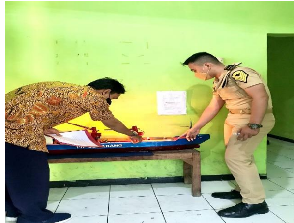
Gambar 4. Uji Alat Peraga dengan Ahli

Pada penelitian ini melibatkan ahli dalam bidang permesinan untuk melakukan uji coba alat peraga. Uji coba pada Gambar 4 tersebut dilakukan pada tanggal 03 Februari 2022. Dari uji coba tersebut, pada penelitian ini didapatkan masukan terkait bagaimana mendeskripsikan cara kerja alat tersebut.