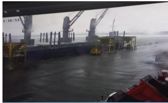
Gambar 1. Cuaca Buruk di Pelabuhan

Pada rekaman CCTV yang menunjukkan kondisi di Pelabuhan Tanjung Intan, hujan deras tampak mengguyur kawasan pelabuhan, menyebabkan seluruh aktivitas bongkar muat terhenti sementara. Hujan lebat ini mengakibatkan area dermaga basah dan licin, sehingga tidak memungkinkan pekerja untuk melanjutkan operasional dengan aman. Alat-alat berat dan kontainer terlihat diam tanpa aktivitas, menandakan bahwa proses bongkar muat dihentikan hingga cuaca membaik. Selain dari foto di atas, terdapat juga bukti laporan dari dokumen timesheet pada jam 18.15-19.25 WIB menunjukkan aktivitas bongkar muatan gandum terhenti karena hujan.