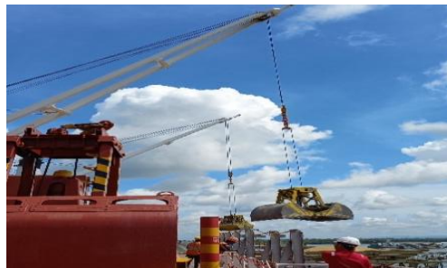
Gambar 3. Crane yang Sedang Melakukan Proses Bongkar Gandum Sumber: Dokumentasi Penelitian, 2024.

Gambar diatas menunjukkan crane yang sedang melaksanakan proses bongkar muat dengan mengangkat muatan gandum dari kapal ke dermaga. Terlihat lengan panjang crane bergerak hati-hati, memastikan muatan gandum diturunkan dengan aman dan efisien. Operator crane bekerja dengan penuh konsentrasi, memantau setiap pergerakan untuk menghindari kesalahan dan memastikan kelancaran operasional di pelabuhan.