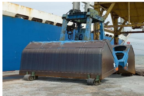
Gambar 4. Grab yang Kurang Terawat

keandalan dan daya tahan peralatan hingga efisiensi dan keamanan operasional, semua bergantung pada kemampuan dan spesifikasi teknis dari peralatan yang digunakan. Dengan memperhatikan faktor teknis ini secara cermat, operator dapat memastikan bahwa peralatan bongkar muat tidak hanya dapat menangani beban dengan efisien, tetapi juga dapat beroperasi dalam berbagai kondisi lingkungan yang mungkin berubah-ubah. Hasil pengamatan dari peneliti menunjukkan bahwa peralatan bongkar muat yang berada di Pelabuhan Tanjung Intan Cilacap terlihat sudah cukup tua dan kurang terawat. Meskipun masih dapat digunakan, kondisi peralatan tersebut menimbulkan kekhawatiran akan efisiensi dan keamanan operasional pelabuhan.