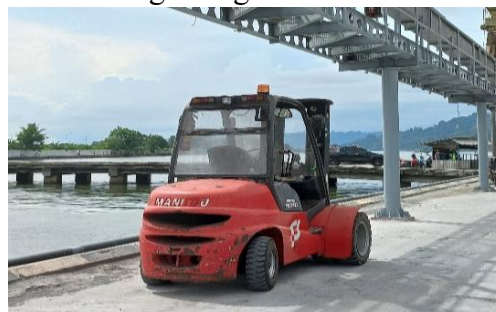
Gambar 5. Forklift yang Kurang Terawat

Dari gambar diatas menunjukkan bahwa crane ini dampak dari kurangnya perawatan dan pemeliharaan. Fenomena ini menekankan pentingnya prosedur pemeliharaan rutin untuk mencegah degradasi fasilitas vital di kawasan pelabuhan.